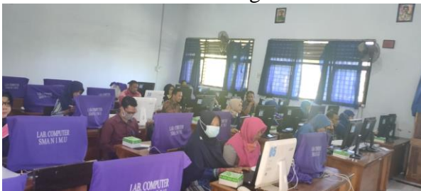
Gambar 2 Kegiatan Simulasi Submit Artikel pada Jurnal Online

Adapun tahapan pada kegiatan simulasi ini, yakni (1) guru didampingi membuat akun (email). (2) melakukan pencarian jurnal yang akan dituju, (3) melakukan registrasi pada jurnal yang akan dituju, (4) melakukan submit artikel sesuai dengan langkah-langkah berdasarkan versi OJS jurnal yang dipilih. Berikut ini dokumentasi kegiatan simulasi.