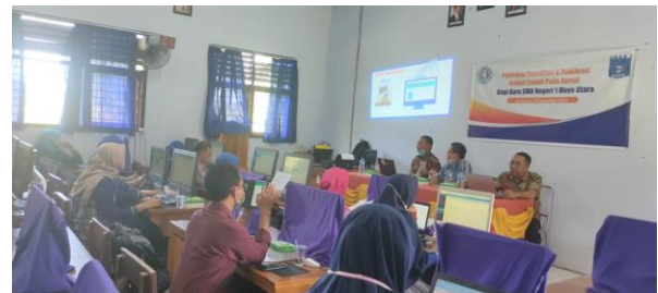
Gambar 1 Kegiatan Penyampaian Materi

Pratisipasi guru dalam kegiatan pemaparan dan diskusi materi sangat bagus. Hal ini ditunjukkankkan dengan keseriusan dan aktifan guru dalam mendengar maupun bertanya terkait dengan materi disampaikan. Berikut ini dokumentasi saat penyampaian materi.