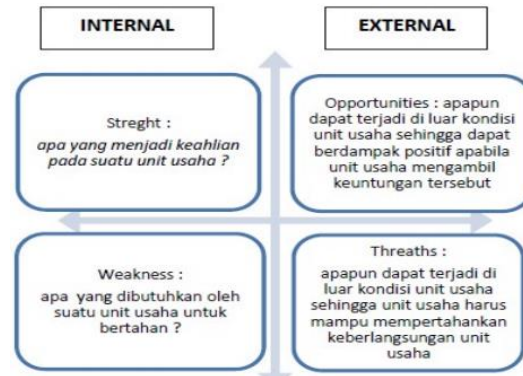
Gambar 1. (a) SWOT Analysis Framework and (b) SWOT Analysis Matrix