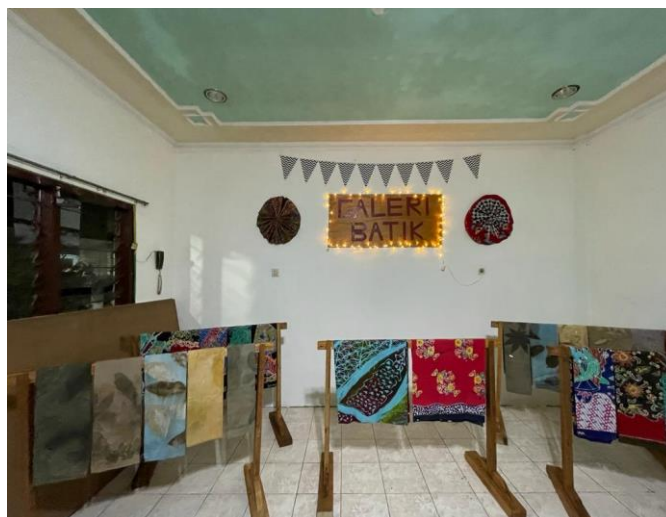
Gambar 3 Hasil Galeri Batik

Atas persetujuan masyarakat dan mendengarkan beberapa masukan, kelompok segera melakukan realisasi galeri batik yang telah disetujui. Galeri batik berisi gawangan batik, etalase penyimpanan dan hiasan batik. Lalu disesuaikan dengan kondisi tempat yang kecil sehingga galeri terlihat lebih luas.