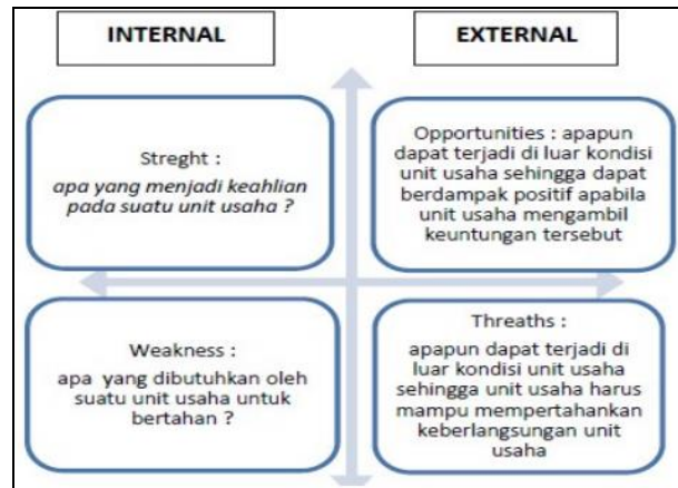
Gambar a) SWOT Analysis Framework, b) SWOT Analysis Matrix