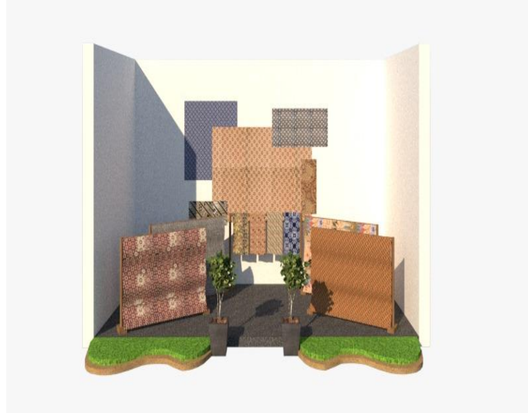
Gambar 2 Pembuatan Desain Galeri Batik

Konsep yang dicanangkan yang dilakukan sebagai wujud pengabdian masyarakat terhadap UMKM Batik adalah pembuatan Galeri Batik yang terletak di RW 04 Kelurahan Gundih. Diketahui sebelumnya ide pembuatan galeri sudah menjadi cita-cita masyarakat sebagai tempat hasil karya batik sekaligus tempat pemesanan dan sarana pembelajaran membatik. Langkah pertama dalam pembuatan galeri batik yaitu pembuatan desain dan konsep yang akan dilaksanakan. Berikut merupakan contoh desain yang telah dibuat.