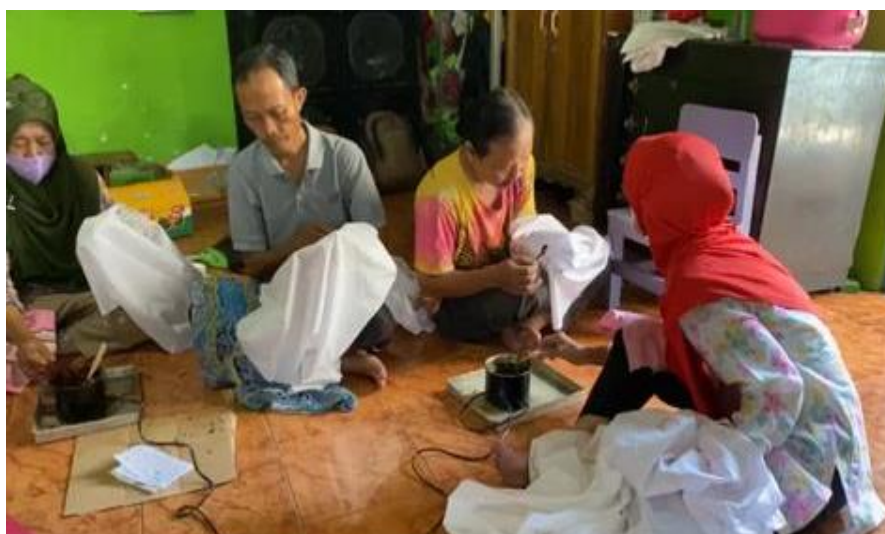
Gambar 1. Pemberdayaan Masyarakat Membuatik

Hasil dari pengabdian masyarakat yang dilakukan peneliti memberikan beberapa informasi bahwa kekayaan budaya dan keragaman khas yang dimiliki setiap wilayah di Surabaya menjadikan potensi besar yang bisa dikembangkan sebagai tempat pariwisata. Sesuai dengan penelitian yang dilakukan penulis kegiatan UMKM Batik yang berada di Kelurahan Gundih menarik untuk dijadikan sebagai pariwisata kreatif yang unik karena diketahui Pariwisata Batik sangat sulit ditemui di Surabaya. Nilai tambah yang ditawarkan oleh UMKM Batik adalah mereka menggunakan teknik ecoprint yang ramah lingkungan dan batik tulis dengan ciri khas batik tin. Sebuah tantangan besar bagi Kota besar untuk menghadapi globalisasi dalam perekonomian dengan upaya membantu industri kecil dengan meningkatkan pariwisata di wilayah industri. Sektor pariwisata memiliki multiplayer effect yang dapat meningkatkan tenaga kerja diluar sektor pariwisata seperti sektor industri, sektor pertanian dan sektor lainnya. Sehingga mampu menciptakan lapangan pekerjaan, peningkatan pendapatan dan kesejahteraan masyarakat (Agung Yoga Bhaskara et al., 2019) . Dengan memfokuskan pada kegiatan pemberdayaan masyarakat di Kelurahan Gundih diyakini dapat membantu produktivitas masyarakat sekitar sehingga pengembangan UMKM Batik dapat berjalan maju.