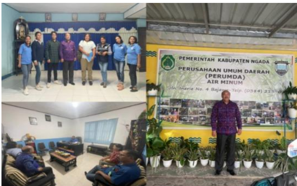
Gambar 2. Dokumentasi Kegiatan Pendampingan Perusahaan Umum Daerah Air Minum Kabupaten Ngada Untuk Pembenahan Pencatatan Aset Tetap yang belum ditetapkan Statusnya

Sejalan dengan pembenahan pencatatan aset tetap, Perumda Air Minum Kabupaten Ngada juga mulai mengimplementasikan perubahan pedoman akuntansi keuangan, dari sebelumnya menggunakan Standar Akuntansi Entitas Tanpa Akuntabilitas Publik (SAK ETAP) menuju Standar Akuntansi Keuangan Entitas Privat (SAK EP). Perubahan ini bersifat fundamental karena mempengaruhi seluruh proses pencatatan transaksi keuangan, penyusunan laporan keuangan, dan pengungkapan informasi akuntansi. SAK EP dirancang untuk memberikan kesederhanaan, konsistensi, dan fleksibilitas bagi entitas privat yang tidak menghimpun dana dari publik namun tetap memiliki kewajiban pelaporan kepada regulator dan pemangku kepentingan. Dalam konteks BUMD, perubahan ini membawa konsekuensi pada perlunya restrukturisasi sistem akuntansi internal, penyesuaian kebijakan keuangan, dan peningkatan kapasitas sumber daya manusia agar mampu memahami dan menerapkan standar baru secara efektif. Beberapa perbedaan mendasar antara SAK ETAP dan SAK EP antara lain adalah perlakuan terhadap aset keuangan, metode pengukuran aset tetap, dan perlakuan atas instrumen keuangan derivatif, meskipun tidak semuanya relevan dengan aktivitas Perumda Air Minum, namun tetap memerlukan pemahaman yang mendalam agar tidak terjadi salah penyajian informasi dalam laporan keuangan.