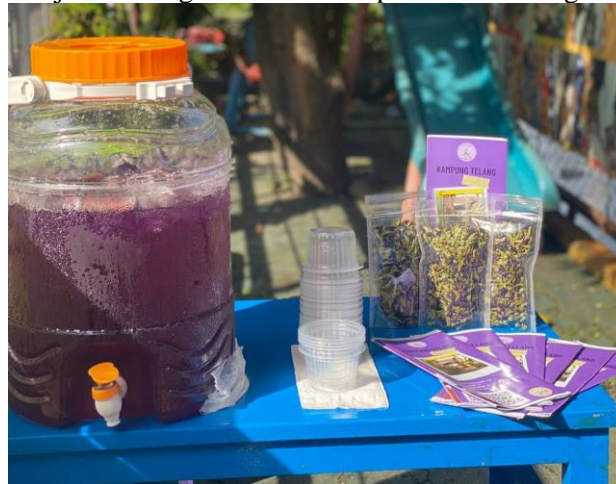
Gambar 1 Kegiatan Sosialisasi Produk Olahan Bunga Telang

Kegiatan pertama yang dilakukan yaitu sosialisasi pada warga. Kegiatan ini dilaksanakan dengan mengumpulkan beberapa warga di satu tempat dan memberikan materi mengenai bagaimana melakukan budidaya bunga telang. Kegiatan sosialisasi dapat terlebih dahulu menyiapkan materi dan hasil dari olahan yang mana dapat dipertunjukkan dan dicoba oleh penerima informasi (warga masyarakat). Biasanya sosialisasi dapat dikemas dengan cara demo praktik, pameran produk, dan seminar. Materi yang dapat disampaikan yaitu tentang identitas dan manfaat bunga telang beserta budidaya perawatannya dilanjutkan dengan hasil olahan produk dari bunga telang.