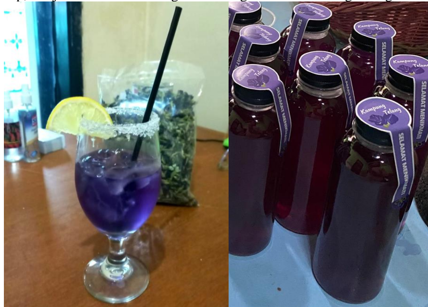
Gambar 4 Teh Herbal Bunga Telang Siap Disajikan