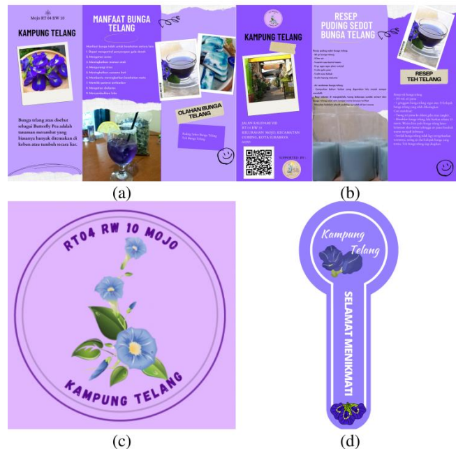
Gambar 6 (a) Brosur Tampak Depan, (b) Brosur Tampak Belakang, (c) Logo Branding Kampung Telang Mojo, (d) Stiker Packaging Produk Olahan Bunga Telang

Berdasarkan pelaksanaan kegiatan diatas, pelaksanaan program hanya sedikit warga yang mengetahui eksistensi bunga telang, seiring berjalannya program warga sangat antusias ketika kami memberikan penjelasan mengenai tanaman bunga telang beserta manfaat yang ada. Setelah pelaksanaan kegiatan pengabdian kepada masyarakat yang dilangsungkan melalui program