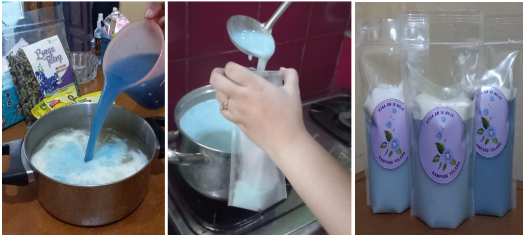
Gambar 3 Proses dan Hasil Membuat Puding Sedot Bunga Telang