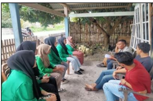
Gambar 1.Observasi dengan kepala desa