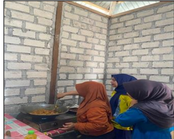
Gambar 3. Proses Pendampingan produksi sambal ikan taminong