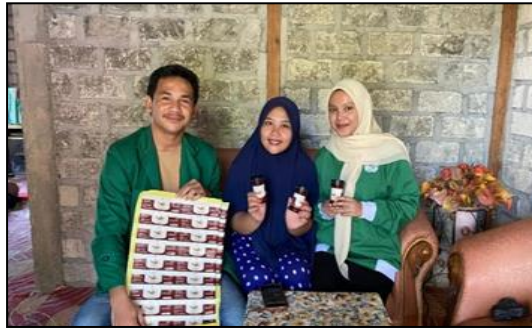
Gambar 4. Proses Pendampingan produksi sambal ikan taminong

Tim pengabdian masyarakat dari Universitas Muhammadiyah Luwuk Banggai yang terdiri dari dosen dan mahasiswa KKN MB memberikan pendampingan produksi sambal ikan taminong kepada Ibu PKK Desa Tombos. Materi pendampingan yang diberikan kepada Ibu PKK adalah melakukan produksi sambal ikan taminong. Dengan memberikan proses pendampingan kepada Ibu PKK di harapkan produksi sambal ikan taminong bisa terus berkembang. Dalam proses dibutuhkan kemampuan sumber daya manusia, ketelatenan dan kesabaran dalam memproduksi sambal ikan taminong.