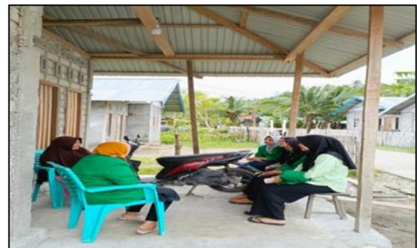
Gambar 2. Koordinasi bersama ibu ketua PKK