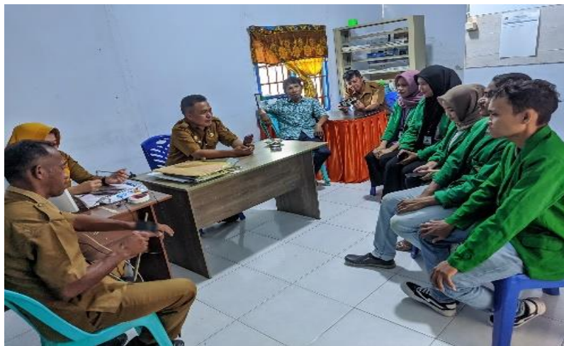
Gambar 1. Observasi pendampingan pembuatan akun facebook dan blogspot

Observasi ini dilaksanakan oleh Mahasiswa Magang Kerja Mandiri (MKM) Kepada pemerintah desa bertempat di kantor desa Lumpoknyo pada tanggal 6 Mei 2024.