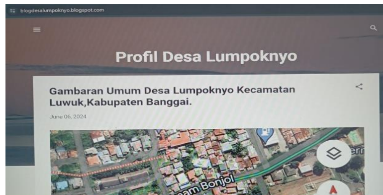
Gambar 5. Hasil pengaplotan data profil desa.

Setelah selesai pembuatan blogspot, kami mahasiswa magang kerja mandiri dan operator melanjutkan pengaplotan data profil desa Lumpoknyo ke halaman tersebut.