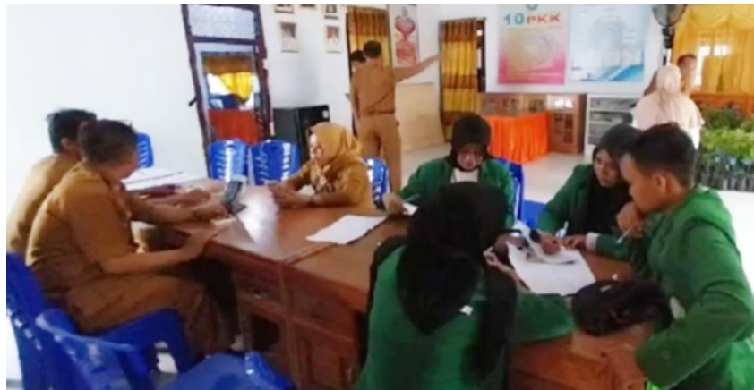
Gambar 2. Koordinasi Kegiatan PKM dan Sosialisasi Fakultas Ilmu Sosial dan Ilmu Politik UML.

Koordinasi yang dilaksanakan kegiatan ini melalui wawancara dengan Pemerintah desa. Materi yang dibahas dengan Pemerintah Desa Lumpoknyo tentang waktu, Tempat dan narasumbernya untuk Pendampingan pembuatan akun facebook dan blogspot Desa. dan Sosialisasi Fakultas Ilmu Sosial Dan Ilmu Politik UML. Setelah melakukan koordinasi di lanjutkan dengan persiapan tempat pelaksanaan pendampingan kegiatan.