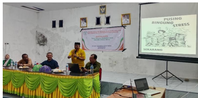
Gambar 3. Penyampaian materi oleh Dosen Fakultas Ilmu Sosial Dan Ilmu Politik Universitas Muhammadiyah Luwuk

Tahap selanjutnya adalah tahap pelaksanaan sosialisasi ini dilaksanakan pada tanggal 30 Mei 2024 bertempat di Balai Pertemuan Umum Desa Boyou Kecamatan Luwuk Utara Kabupaten Banggai dengan tujuan untuk meningkatkan pengetahuan, kemampuan dan keterampilan Pemerintah Desa dalam Pengelolaan Administrasi Pemerintahan.