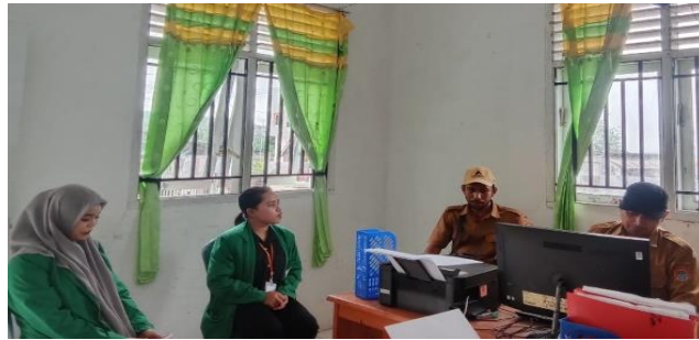
Gambar 2. Koordinasi bersama Perangkat Desa Boyou Kecamatan Luwuk Utara Kabupaten Banggai dalam rangka persiapan pelaksanaan Sosialisasi.

Berdasarkan hasil koordinasi yang dilakukan bersama dengan sekretaris desa dan pemerintah desa lainnya, maka tempat dan waktu pelaksanaan kegiatan di tentukan sesuai kesepakatan pemerintah desa dan mahasiswa dilakukan pada tanggal 30 Mei 2024 tepat pada pukul 19:30 bertempat di balai pertemuan umum Desa Boyou, dan mengundang narasumber yaitu Dosen Fakultas Ilmu Sosial Dan Ilmu Politik Universitas Muhammadiyah Luwuk bahkan kami juga telah menentukan tamu undangan yang diharapkan untuk menghadiri kegiatan sosialisasi yang akan dilaksanakan.