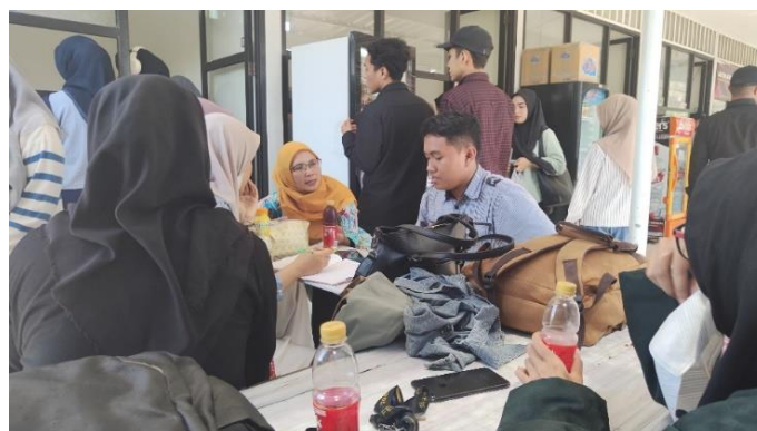
Gambar 3. Proses Sosialisasi