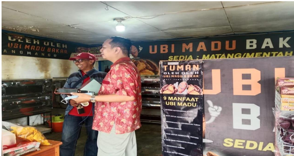
Gambar 3. Penjelasan oleh Tim Pengabdian tentang perilaku UMKM Ubi Ungu Oven