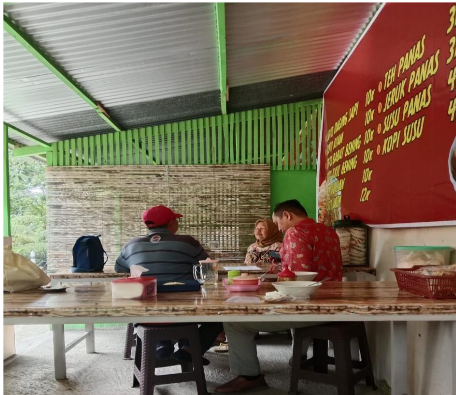
Gambar 2. Tim Pengabdi kegiatan Pengabdian kepada pelaku Usaha di Warung