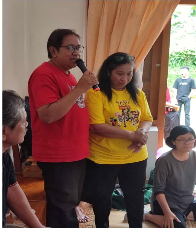
Gambar 1. Pengembangan Produk berbasis Inovasi untuk Pelaku UMKM Tawangamngu

Berikut ini ada foto kegiatan pengabdian kepada masyarakat