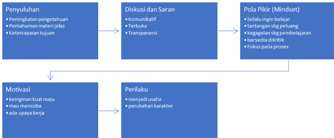
Gambar 6. Alur Kebermanfaatn Kegiatan Pengabdian Masyarakat

Pada akhir acara, peserta diberi kesempatan untuk menyampaikan pendapat dan saran. Aspek yang ditinjau meliputi semua tahapan pelaksanaan kegiatan. Berdasarkan hasil kritik dan saran menunjukkan bahwa pelaku UMKM sangat senang dengan kegiatan ini. Menurut peserta pengabdian, membuat produk makanan inovatif merupakan tantangan yang menarik, yang dapat dilakukan merupakan hal yang baru dan bermanfaat baik untuk dikonsumsi sendiri maupun untuk diperdagangkan. Kegiatan pengabdian kepada masyarakat dengan pelaku UMKM ini, juga berharap agar pengabdian ini dapat manfaat dalam rangsangan pelaku untuk lebih kreatif dan inovatif.