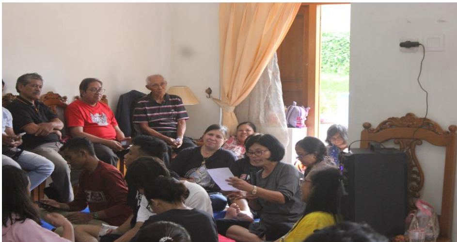
Gambar 4. Kebersamaan Tim Pengabdian dengan diskusi Kegiatan