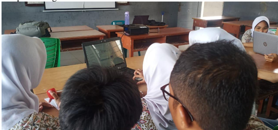
Gambar 2. Masing-masing Kelompok Melakukan Diskusi Penggunaan GeoGebra

Tahap pendampingan dilakukan dengan mengajak siswa dari masing-masing kelompok untuk melakukan demonstrasi tentang materi transformasi geometri di hadapan kelompok lain, tim PKM, dan guru mata pelajaran. Berdasarkan demonstrasi yang dilakukan siswa, terlihat bahwa siswa mampu memaparkan materi dengan baik dengan tahapan yang benar menggunakan aplikasi GeoGebra . Siswa dari kelompok lain sangat antusias terhadap demonstrasi siswa tersebut dan aktif pada diskusi dalam merefleksi kesimpulan dengan benar.