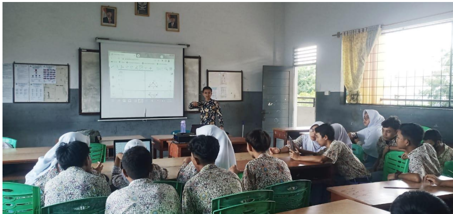
Gambar 1. Pemateri Melakukan Demonstrasi Penggunaan GeoGebra

Pada tahap demonstrasi, tim PKM menemukan siswa dari sekolah mitra kurang mampu dalam menyelesaikan masalah terkait materi transformasi geometri yang telah dipelajari bersama guru sebelumnya, dan hanya beberapa siswa saja yang mampu dan itupun dalam bentuk ingatan/pengetahuan semata. Berikut sesi demonstrasi yang dilakukan oleh tim PKM kepada siswa sekolah mitra tersaji pada Gambar 1 berikut.