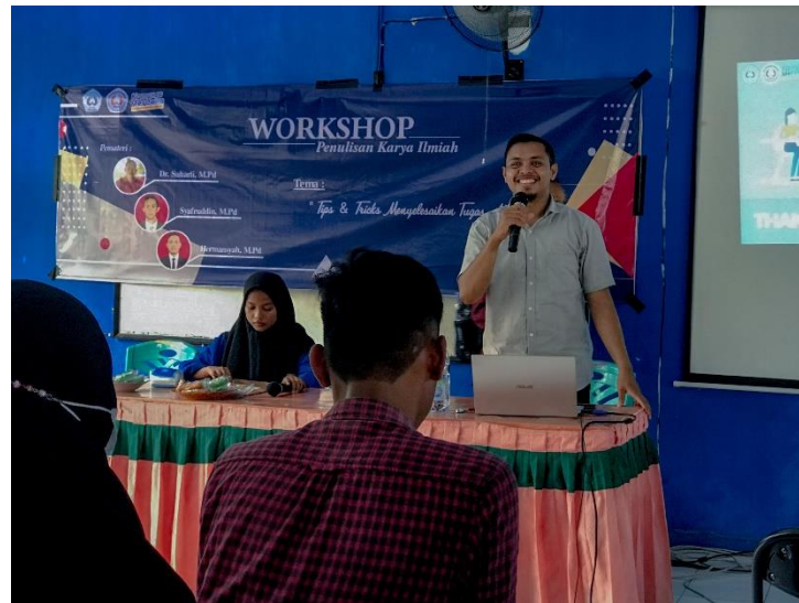
Gambar 1. Penyampaian Materi Workshop

Pemberian materi lokakarya tersebut didengarkan oleh 50 orang mahasiswa dengan 3 tingkatan semester yang didominasi oleh mahasiswa semester akhir yaitu semester 7 yang sedang mengambil MK Skripsi. Mahasiswa selain semester akhir ikut serta dikarekan mereka ingin menambah wawasan terkait penyusunan tugas akhir dan tugas-tugas makalah MK yang dicapai. Selain itu, mahasiswa yang mengikuti kegiatan ini memiliki alasan karena mereka membutuhkan materi terkait hal ini dalam proposal Program Kreativitas Mahasiswa sehingga pengutipan dan pengelolaan referensi menjadi lebih efisien dan rapi. Gambar 1 menampilkan pemateri yang sedang memberikan materi dengan Teknik ceramah. Pada Gambar 2 ditampilkan materi slide melalui PPT sehingga mahasiswa menjadi lebih memahami dengan melihat materi selain mendengarkan pemateri yang menyampaikan dengan Teknik ceramah. Hal ini seperti yang dikemukakan oleh Prapdopo & Fariyanti (2016) dimana saya mendengar saya lupa, saya melihat saya ingat, dan saya melakukan saya mengerti. Pelaksanaan kegiatan pada saat tahap pelaksanaan sesuai dengan pendapat tersebut di atas.