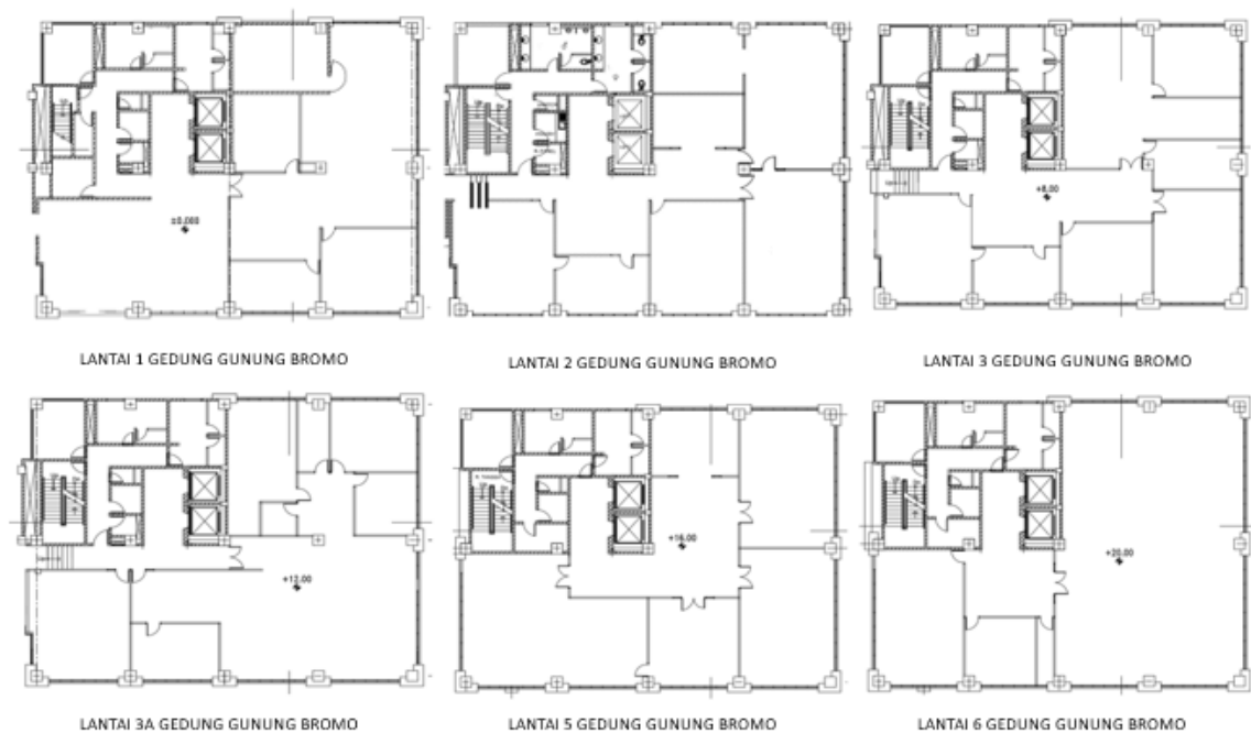
Gambar 2. Denah Gedung Gunung Bromo Lantai 1 – 6

Berdasarkan hasil pengamatan Gedung Gunung Bromo telah memiliki beberapa sarana penyelamatan bahaya kebakaran seperti tangga, pintu, exhaust, dan tanda penunjuk ke luar, tombol alarm kebakaran, hidran, sprinkler, tabung pemadam, detektor asap, panas, dan api, serta petunjuk arah. Berikut hasil pengamatan sarana evakuasi penyelamatan, terdapat di Permen no.45 (Kementerian Pekerjaan Umum, 2007), Permen PU no. 26 tahun 2008 (Kuliah et al., 2018), SNI 03-1746-2000, dan SNI 03-6574-2001 (Badan Standardisasi Nasional, 2001).