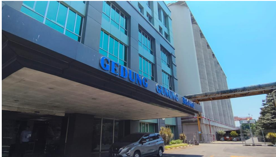
Gambar 1. Foto Gedung Gunung Bromo Tampak Luar