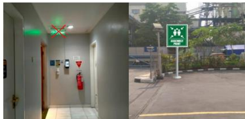
Lantai 1 gedung bromo