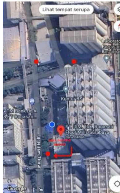
Gambar 5. Site Plan

Gambar site plan menggambarkan situasi area Gedung Gunung Bromo dan jalur evakuasi luar bangunan termasuk lokasi titik kumpul. Site plan dapat dilihat pada gambar berikut.