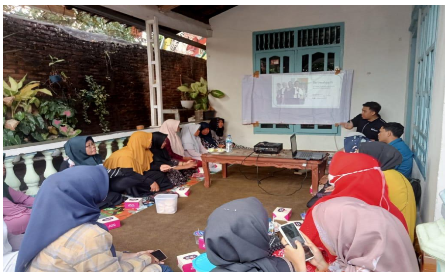
Gambar 2. sosialisasi

Dalam tahapan ini menjelaskan QRIS, dimana selain digunakan untuk pembayaran secara online yang lebih mudah, cepat, dan terjaga keamanannya. QRIS ini dapat diakses melalui dompet elektronik atau mobile banking yang memiliki fitur pembayaran menggunakan QR Code. Dalam hal ini tim sosialisasi pada kegiatan dapat memberikan penjelasan lebih dalam lagi mengenai QRIS, beberapa anggota ibu-ibu kader posyandu melati 3B telah mengenal QRIS dan salah satu sudah ada yang menggunakannya. QRIS memungkinkan pedagang dan konsumen untuk melakukan transaksi tanpa menggunakan uang tunai, meningkatkan kecepatan dan kenyamanan pembayaran. Selain itu, QRIS juga dapat digunakan untuk memfasilitasi program loyalitas, memberikan diskon, dan menyediakan informasi tambahan tentang produk atau layanan. Berikut dokumentasi tentang sosialisasi yang dilakukan oleh tim: