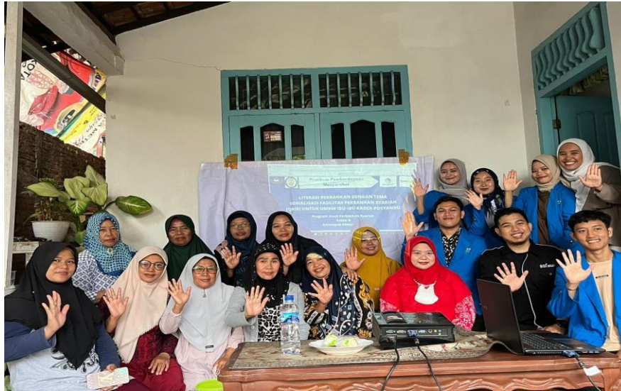
Gambar 1. Dokumentasi Kegiatan PKM

Tahap awal yaitu pembukaan dan dilanjutkan dengan menyampaikan tujuan adanya sosialisasi tentang Literasi Perbankan Syariah Dengan Tema Sosialisasi Fasilitas Perbankan Syariah (QRIS) Untuk UMKM Ibu-Ibu Kader Posyandu Melati 3B. pada kegiatan ini dihadiri oleh 20 orang.