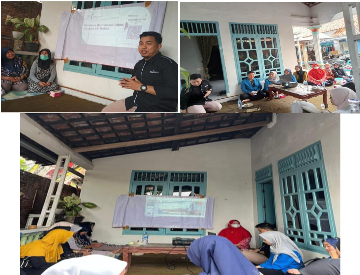
Gambar 3. Pemaparan Materi

Syarat yang harus dipersiapkan yaitu dengan membawa KTP,setelah itu dipandu oleh bapak satpam untuk membuka aplikasi BSI Mobile.setelah jadi lalu kita diarahkan ke CS untuk membuat kartu rekening dan dan membuat nama untuk QRIS.