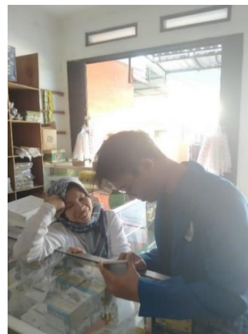
Gambar 2. Dokumentasi Pelatihan