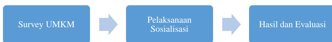
Gambar 1. Alur Metode Pelaksanaan

Kegiatan PKL-PKM ini dilaksanakan dalam bentuk penjelasan dan sosialisasi langsung kepada masing-masing UMKM secara individual. Berikut adalah uraian metode yang digunakan dalam pelaksanaan sosialisasi pencatatan laporan keuangan sederhana melalui aplikasi Toko Ku pada UMKM di Desa Pekuwon :