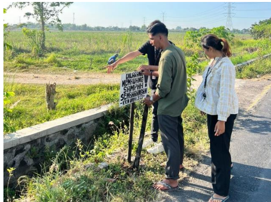
Gambar 1.4 Pemasangan plang pemberitahuan larangan buang sampah