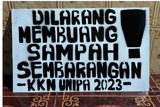
Gambar 1.3 Hasil plang pemberitahuan larangan buang sampah