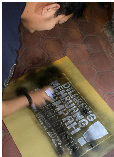
Gambar 1.2 Pembuatan plang pemberitahuan

Untuk mengantisipasi adanya warga yang nekat untuk buang sampah sembarangan di Desa Balong Garut, kami ikut serta berpartisipasi dalam upaya tersebut dengan memasang plang pemberitahuan larangan buang sampah sembarangan. Pemasangan plang pemberitahuan ini selain sebagai pengingat kepada warga, juga sebagai upaya untuk menjaga kebersihan lingkungan Desa Balong Garut