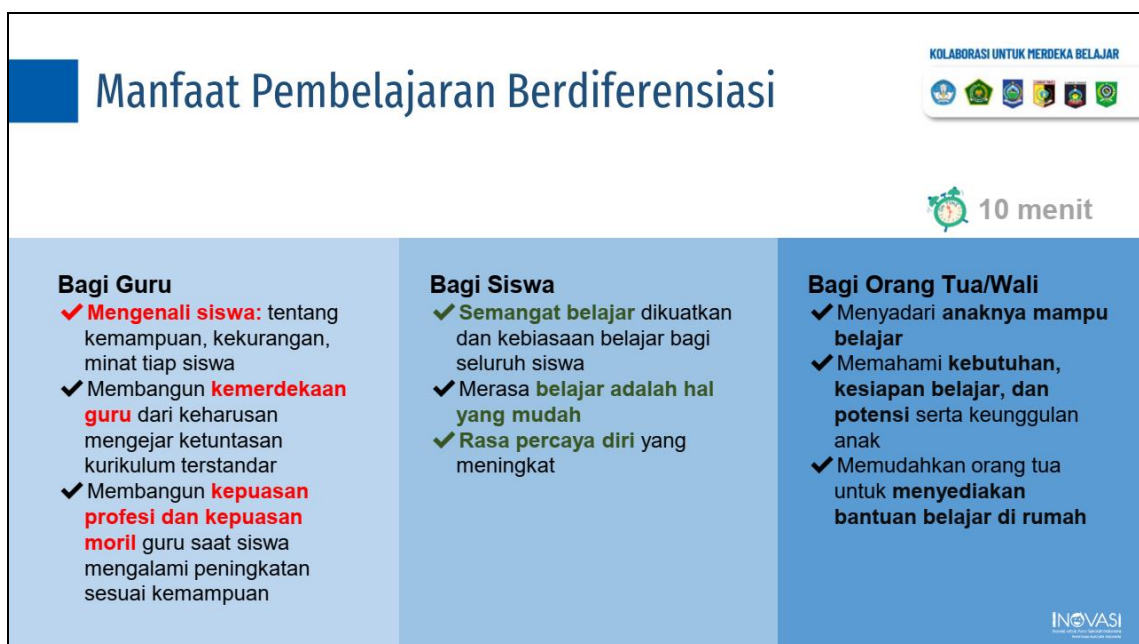
Gambar 2. Manfaat Pembelajaran Berdiferensiasi