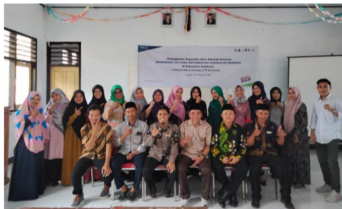
Gambar 6. Sesi Foto Bersama Peserta Pelatihan