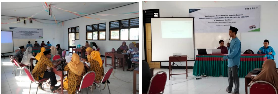
Gambar 4. Penyampaian Materi oleh Narasumber

Setelah mendapatkan materi tentang karakter pembelajaran berdiferensiasi, peserta pelatihan juga diberikan contoh tentang bagaimana penerapannya di dalam kelas, menggunakan berbagai sumber belajar yang tersedia. Untuk memastikan peserta memahami materi pelatihan dengan baik, kami mengajak mereka untuk bermain peran. Beberapa guru peserta pelatihan kami minta untuk mendemonstrasikan pembelajaran berdiferensiasi di depan sebagai guru, sementara peserta yang lain berperan sebagai siswa. Mereka sukses mendemonstrasikannya, dan membuat suasana pelatihan menjadi lebih menarik. Berdasarkan analisis hasil pretes dan postes peserta pelatihan, dapat diketahui bahwa skor rerata postes lebih tinggi pretes. Hal ini mengisyaratkan bahwa materi pelatihan telah dapat dipahami dengan baik oleh peserta (Yahya, 2021).