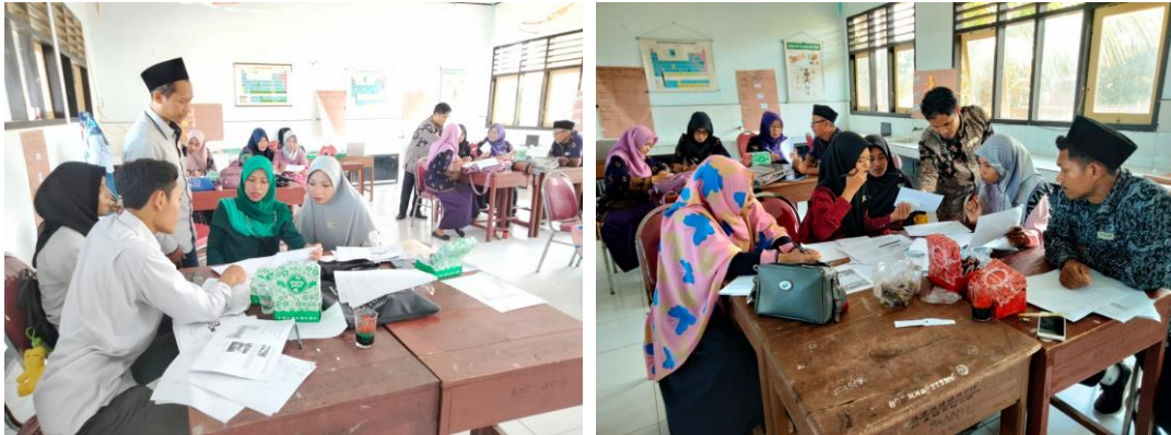
Gambar 5. Pendampingan Sesi Diskusi Kelompok Peserta Pelatihan