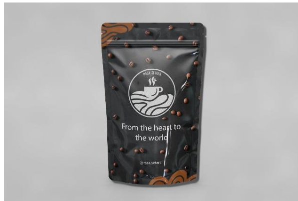
Gambar 2. Mock Up Kemasan Produk Biji Kopi Arabika Panggang

Kemasan produk merupakan bagian terpenting dari suatu produk dalam memberikan kesan pertama kepada calon konsumen. Fungsi kemasan pada produk meliputi beberapa hal yang penting, yaitu: Pertama, kemasan berperan sebagai wadah yang memungkinkan pengangkutan produk dari satu tempat ke tempat lain, baik dari produsen ke konsumen maupun antarlokasi lainnya. Kedua, kemasan juga bertujuan untuk melindungi produk yang terkemas dari berbagai pengaruh negatif seperti cuaca, benturan, dan tumpukan yang dapat merusak kualitasnya. Ketiga, kemasan memiliki peran penting dalam memberikan informasi kepada konsumen, membangun citra merek, serta berfungsi sebagai media promosi yang mudah dilihat, dipahami, dan diingat (Widiati, 2019). Oleh karena itu, kebutuhan kemasan dalam menyampaikan informasi menjadi aspek yang sangat vital. Selain itu, pemberian label dan merek pada produk memiliki kepentingan yang besar sebagai elemen pembeda terhadap pesaing di pasar.