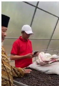
Gambar 1. Peninjauan Lokasi UMKM dan Diskusi Tatap Muka untuk Kerjasama dengan UMKM Kopi