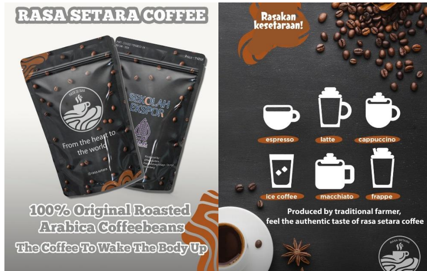
Gambar 4. Konten promosi

Konten merujuk pada substansi, jenis, atau unit informasi digital yang terdiri dari teks, gambar, grafik, video, audio, dokumen, laporan, dan berbagai elemen lainnya (Catur, 2022). TSE memberikan bantuan dalam mendesain konten promosi yang dapat digunakan di sosial media UMKM Kaduwulung. Adanya konten di sosial media sangat bermanfaat dalam memperkenalkan produk kepada khalayak sehingga calon konsumen tertarik untuk membeli produk. Melalui konten tersebut, konsumen dapat memiliki informasi mengenai produk UMKM Kaduwulung hingga olahan yang bisa dihasilkan dari biji kopi arabika panggang. Dalam melakukan aktivitas promosi dan onboarding , produk UMKM Kaduwulung menggunakan merek “Rasa Setara Coffee”