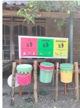
Gambar 2. Tong Sampah Sumber : Dokumentasi Peneliti, 2023