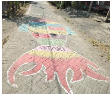
Gambar 1. Permainan Tradisional Engklek