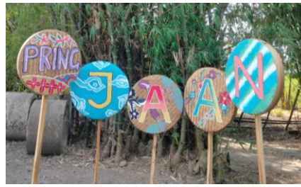
Gambar 4. Spot Foto