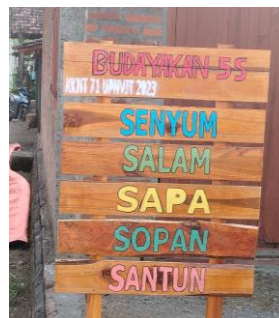
Gambar 3. Plang Edukasi

Selanjutnya, pembuatan spot foto yang ditujukan untuk mempercantik kawasan wisata dan menambah daya tarik pengunjung. Adanya spot foto menjadi salah satu strategi promosi lokasi wisata yang mana masyarakat suka mengunggah foto atau video ke media sosial. Oleh karena itu, penambahan spot foto di sekitar area Dusun Jaan dibuat dengan sangat menarik yang nantinya dapat digunakan sebagai sarana dalam mempromosikan lokasi wisata.