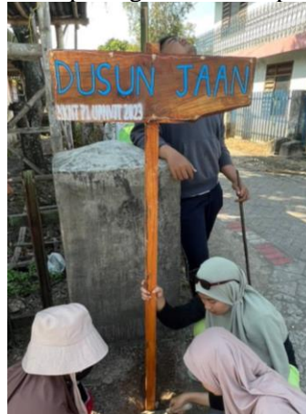
Gambar 5. Papan Nama Dusun