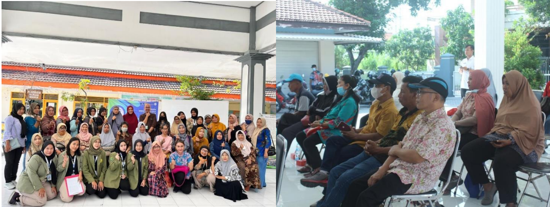
Gambar 2. Sosialisasi dan Edukasi Program BPJS Ketenagakerjaan

Di sini mahasiswa menemukan beberapa alasan yang membuat masih banyaknya masyarakat yang belum mengetahui dan menyadari betapa pentingnya perlindungan jaminan sosial dari BPJS Ketenagakerjaan. Masyarakat masih belum mengetahui apa saja manfaat yang akan didapat dari terdaftarinya mereka pada BPJS Ketenagakerjaan. Selain itu, kurangnya edukasi yang didapat membuat mereka ragu bahkan acuh dengan pentingnya program BPJS Ketenagakerjaan ini.