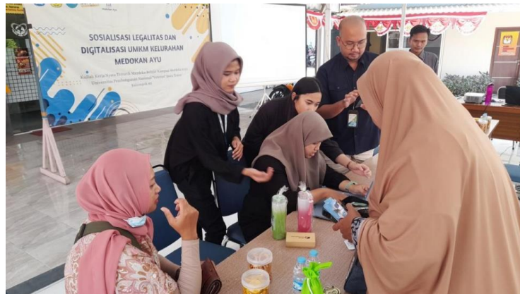
Gambar 3. Melayani Masyarakat yang Ingin Mendaftar BPJS Ketenagakerjaan

Dengan diadakannya proyek sosialisasi dan edukasi dalam meningkatkan awareness perlindungan jaminan sosial ketenagakerjaan kepada masyarakat, mahasiswa menemukan beberapa masyarakat atau pelaku UMKM yang langsung aware atau peduli dengan dirinya sendiri untuk terhindar dari hal-hal yang tidak diinginkan dan di luar kendali saat sedang bekerja. Terbukti dari hasil proyek sosialisasi ini, terdapat beberapa masyarakat yang tertarik dan mendaftarkan dirinya menjadi peserta BPJS Ketenagakerjaan.