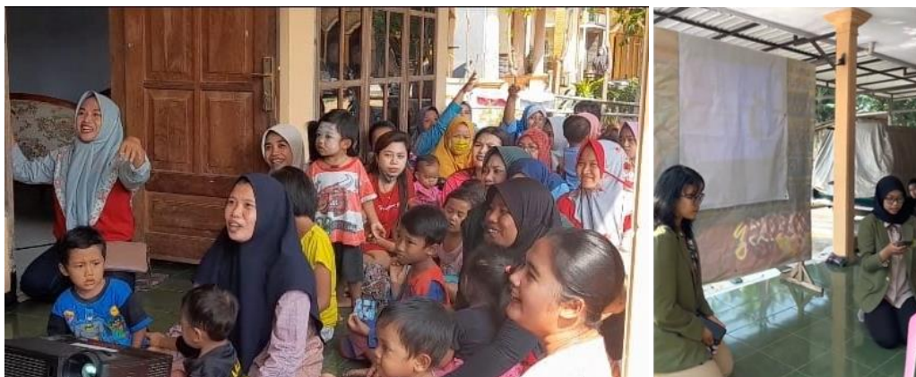
Gambar 4. Proses Sosialisasi Orang Tua Hebat Oleh Pemateri yang Diikuti oleh Para Ibu Hamil di desa Pohsangit Leres

Pembukaan dilaksanakan sebelum materi sosialisasi disampaikan. Pembukaan dibawakan oleh pembawa acara dengan perkenalan diri, perkenalan pemateri dan pemberitahuan mengenai materi yang akan disampaikan kepada para ibu. Setelah pembukaan, penyampaian materi sosialisasi 'Orang Tua Hebat' dilakukan oleh pemateri. Dimana isi materi tersebut terdiri dari dua pokok pembahasan yaitu mengenai pola asuh dan delapan fungsi keluarga. Pola asuh orang tua yang baik berarti para orang tua harus memiliki pemikiran atau kesadaran dalam mengasuh anak. Pola asuh dalam mengurus anak tidak hanya dilakukan oleh ibu saja, tetapi juga ayah. Ayah memiliki peran yang sama seperti ibu dalam pengasuhan anak, yaitu melindungi, mendukung, dan meningkatkan kesehatan, perkembangan, dan kesejahteraan anak dengan berbagi tanggung jawab di rumah. Adapun delapan fungsi keluarga, diantaranya fungsi keagamaan, fungsi sosial budaya, fungsi cinta kasih, fungsi perlindungan, fungsi reproduksi, fungsi sosialisasi dan pendidikan, fungsi ekonomi, dan fungsi pembinaan lingkungan.