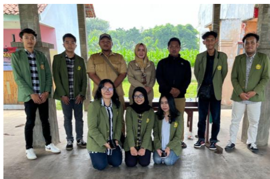
Gambar 2. Tahapan Identifikasi Kebutuhan Materi dan Konsep melalui Survei Lapangan mengenai Penyakit Stunting dan Kondisi Ibu Hamil di Desa Pohnsangit Leres

Dalam proses pelaksanaan kegiatan pengabdian masyarakat ini, ada beberapa tahap dalam metode pelaksanaan yang dilakukan. Pertama, penulis melakukan identifikasi kebutuhan materi dan konsep pelaksanaan dengan melakukan survei lapangan pada tanggal 22 Maret 2023 di desa Pohnsangit Leres. Survei lapangan yang dilakukan dengan melakukan observasi, berkoordinasi dan mengajukan beberapa pertanyaan seputar kondisi stunting dan ibu hamil kepada kepala desa, bidan desa, instansi kesehatan yang ada di kecamatan Sumberasih dan desa Pohnsangit Leres yang terjadi di desa Pohnsangit Leres. Melalui proses identifikasi ini, penulis menemukan bahwa kondisi stunting yang dialami oleh perempuan dan ibu hamil di desa Pohnsangit Leres masih cukup tinggi. Oleh karena itu, desa Pohnsangit Leres pun termasuk menjadi salah satu lokasi khusus bebas stunting di kecamatan Sumberasih (Pemkab Probolinggo, 2022).