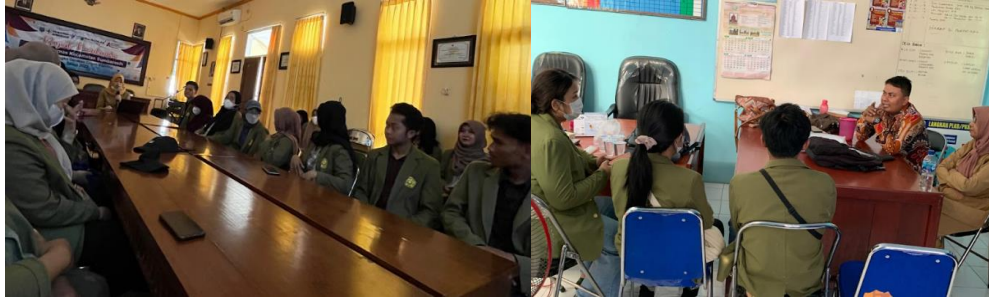
Gambar 3. Tahapan Koordinasi dalam Penyusunan Materi dan Konsep Sosialisasi sebagai Pencegahan Angka Stunting di Desa Pohsangit Leres

kurangnya dukungan pada ibu yang sedang masa kehamilan. Oleh karena itu, materi ini pun membahas mengenai pentingnya peran ayah dalam 1000 Hari Pertama Kehidupan (HPK) dengan harapan dapat memberi pemahaman mengenai pentingnya keseimbangan peran ibu dan ayah selama proses kehamilan hingga kondisi bayi baru lahir.