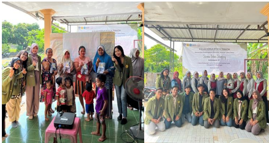
Gambar 5. Foto Pembagian Bingkisan Bersama Para Ibu Penanya dalam Sesi Tanya Jawab dan Foto Bersama dengan Kader Posyandu serta Ibu Kepala Desa

acara dengan menyampaikan sedikit kesimpulan atas materi yang telah dipaparkan dan penyampaian terima kasih kepada pihak-pihak yang terlibat dalam kegiatan sosialisasi.