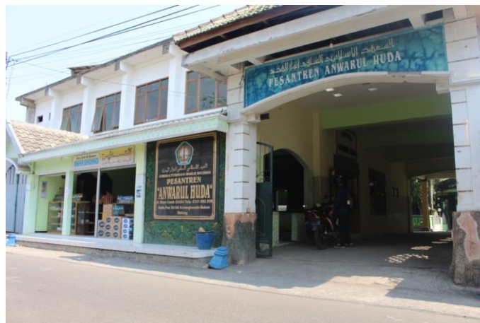
Gambar 1. Tampak Depan Pondok Pesantren Anwarul Huda

Hal tersebut dibuktikan dengan apa yang didapatkan para santri PPAH di dalam pesantren. Para santri PPAH tidak hanya dibekali dengan ilmu-ilmu agama tetapi juga dibekali dengan ketrampilan-ketrampilan dan softskill yang searah dengan perkembangan zaman. Para santri PPAH diharapkan menjadi generasi agamis yang siap menghadapi tantangan perkembangan zaman yang selalu up to date. Hasil dari wawancara tidak terstruktur dengan para santri menunjukkan bahwa pengasuh PPAH seringkali mengadakan pelatihan-pelatihan softskill sehingga tidak aneh bila PPAH memiliki beberapa unit usaha pesantren.