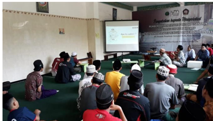
Gambar 2. Para Santri dengan Seksama Mengikuti Kegiatan Sosialisasi