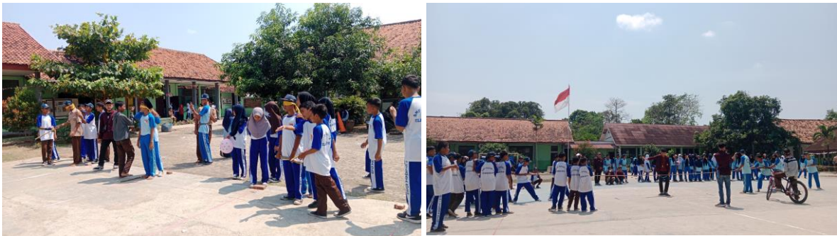
Gambar 1. Persiapan Pelaksanaan Kegiatan Olahraga Tradisional di SMPN 1 Cilamaya Barat Karawang

Olahraga rekreasi adalah suatu kegiatan yang melibatkan anggota fisik yang bergerak di waktu senggang sehingga dapat memperoleh kepuasan secara emosional, seperti kesenangan, kegembiraan, dan kebahagiaan, serta memperoleh kepuasan seperti terpeliharanya kesehatan dan kebugaran tubuh, sehingga tercapainya kesehatan secara menyeluruh. Rekreasi merupakan kegiatan positif yang dilakukan dengan sungguh-sungguh dan bertujuan untuk mencapai kepuasan (Husdarta dalam Setiyowati 2015:30).