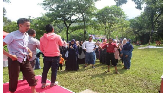
Gambar 1. Persiapan Pelaksanaan Kegiatan Olahraga Rekreasi di Citra Alam Bogor

Berdasarkan pengamatan penulis, karyawan dari Badan Kesatuan Bangsa dan Politik ini sangat sibuk untuk melakukan pekerjaannya masing-masing sehingga untuk melakukan kegiatan olahraga masih sedikit yang memiliki kesadaran terhadap kesehatan untuk diri sendiri. Penulis memilih Lembaga Badan Kesatuan Bangsa dan Politik di Kabupaten Bogor sebagai lokasi untuk penelitian karena berdasarkan hasil pengamatan, karyawan Badan Kesatuan Bangsa dan Politik memiliki semangat melakukan kegiatan olahraga yang tinggi. Mayoritas karyawannya aktif bergerak dan antusias saat dilaksanakannya senam pagi didepan kantor Badan Kesatuan Bangsa dan Politik pada Jum'at pagi.