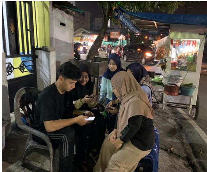
Gambar 2. Pelaksanaan Pelatihan pembuatan akun shopeefood pada UMKM Sate Padang D44n - setia Budi

Berjalannya kegiatan ini, hasil yang dapat dicapai sampai dengan 6 November 2022 yaitu, pendaftaran penjualan via e-commerce seperti ShopeeFood. Pelaksanaan program ini dijalankan oleh kelompok mata kuliah Manajemen Teknologi yang bersedia menerima tanggung jawab pada tugas yang telah diberikan dosen pengampuh ibu Siti Aisyah, SE, MM yang dimana kelompok ini bertanggung jawab mengurus pendaftaran ShopeeFood terhadap UMKM Sate Padang Jln. Setia Budi.