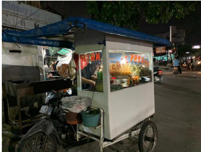
Gambar 1. Survei lokasi UMKM Sate Padang D44n - setia Budi