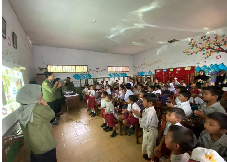
Gambar 2. Mahasiswa Kelompok 15 KKN Tematik Menyampaikan Materi mengenai Pola Hidup Bersih dan Sehat