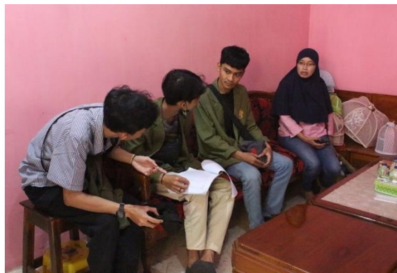
Gambar 1. Sosialisasi Aplikasi BukuKas Oleh Mahasiswa KKNT UPN "Veteran" Jawa Timur

Dengan adanya laporan keuangan ini, UMKM Andin Ecoprint dapat melakukan monitoring mengenai keadaan keuangannya, berbeda dengan sebelumnya yang menggunakan laporan keuangan secara manual. Dimana metode ini tidak menutup kemungkinan dapat terjadi kesalahan pencatatan, hilangnya data keuangan dan kesulitan dalam melakukan rekap keuangan. Rata-rata UMKM juga masih banyak yang belum mengetahui pentingnya laporan laba rugi, posisi keuangan, neraca dan perubahan modal. Hal ini dikarenakan mereka yang masih belum paham mengenai penyusunan laporan.