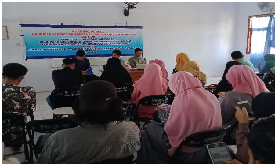
Gambar 1. Pelaksanaan Kegiatan