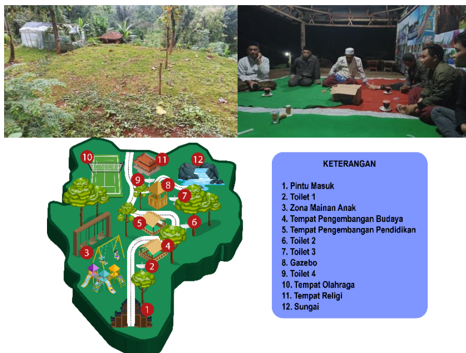
Gambar 2. Pendampingan Perencanaan dan Grand Design Wisata

Alhasil setelah tercipta grand design wisata tersebut nampak konsep wisata padepokan lembah sumilir lebih jelas, mulai dari zona yang akan dibuat dan penempatannya.