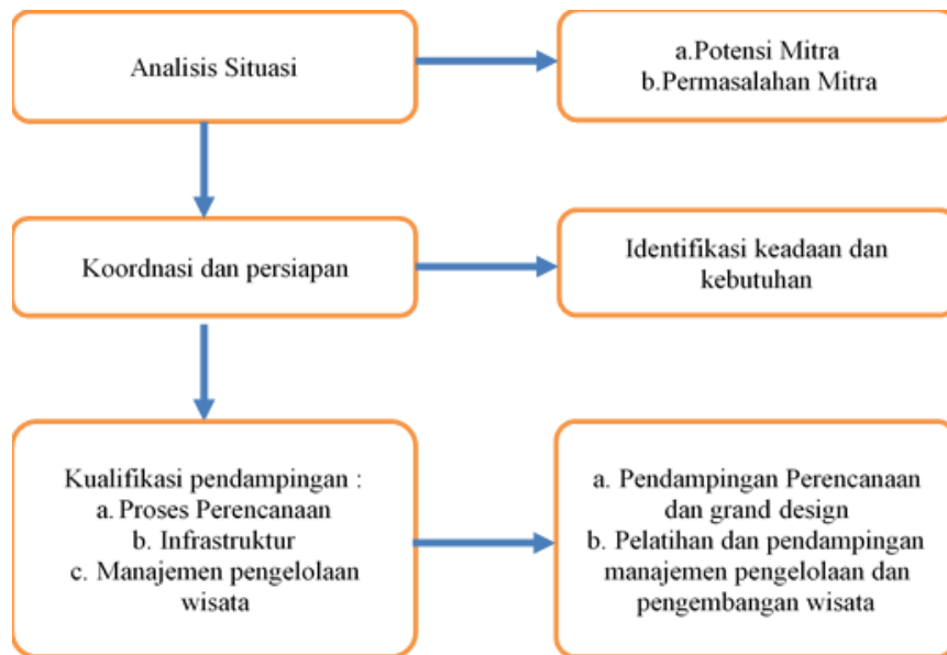
Gambar 1. Metode Pendampingan Mitra