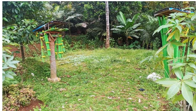
Gambar 3. Hasil pembuatan infrastruktur di zona permainan anak