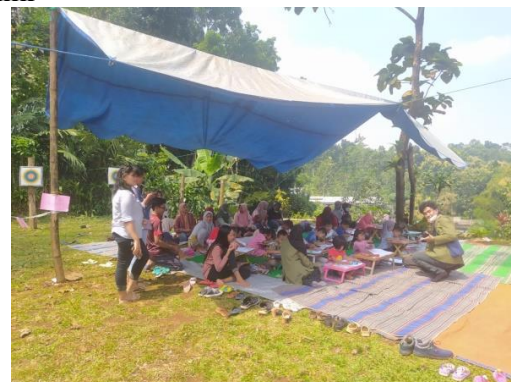
Gambar 5. Branding wisata padepokan lembah sumilir