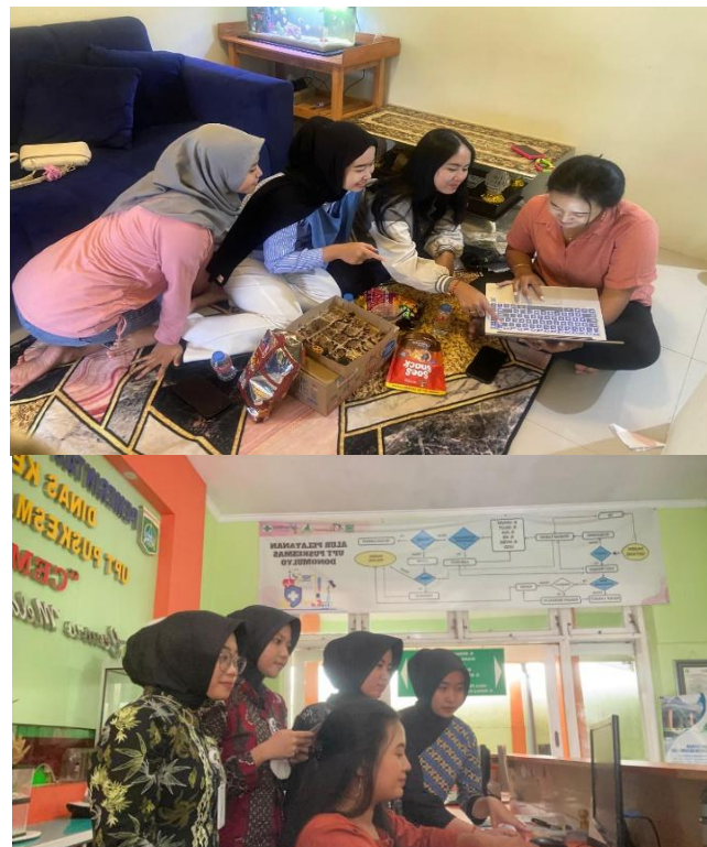
Gambar: Tim Memberikan Materi dalam Pelatihan Petugas

Berikut Dokumentasi dari program pengabdian kepada petugas pendaftaran di Puskesmas Donomulyo: