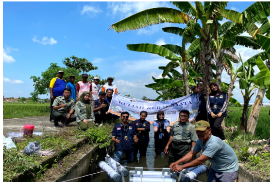
Gambar 2. Pemasangan Trash barrier di Saluran Irigasi Sawah