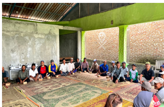
Gambar 1. Pelaksanaan Sosialisasi Trash Barrier dan Bank Sampah

Secara keseluruhan, program integrasi trash barrier dan bank sampah berbasis masyarakat di Desa Ngaren memberikan indikasi awal terhadap perbaikan kondisi lingkungan dan peningkatan kesadaran masyarakat dalam pengelolaan sampah. Berkurangnya penumpukan sampah pada saluran irigasi menunjukkan bahwa penerapan teknologi sederhana yang dipadukan dengan pendekatan partisipatif masyarakat dapat menjadi solusi alternatif dalam mendukung kebersihan lingkungan dan keberlanjutan sistem irigasi pertanian di tingkat desa. Namun demikian, evaluasi jangka panjang masih diperlukan untuk mengetahui efektivitas program secara lebih komprehensif, terutama terkait perubahan perilaku masyarakat dan keberlanjutan pengelolaan sampah berbasis masyarakat.