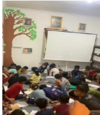
Gambar 5. Ramainya Pengunjung Pasca Pemberdayaan Perpustakaan Desa Maronge