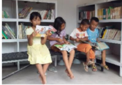
Gambar 1. Kondisi Perpustakaan Desa Maronge Sebelum Renovasi

mengelupas di beberapa bagian dinding. Warna cat biru yang ada sebelumnya dinilai kurang optimal dalam mendukung pencahayaan dan estetika ruangan perpustakaan. Penataan rak buku yang belum terorganisir dengan baik juga menjadi perhatian untuk diperbaiki. Adapun kondisi Perpustakaan Desa Maronge sebelum renovasi dapat dilihat melalui gambar-gambar berikut.