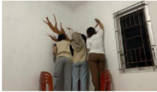
Gambar 3. Proses Dekorasi Tembok berupa Pembuatan Lukisan Pohon di Pojok Ruangan