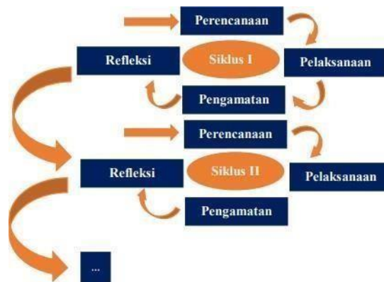
Gambar 1. Model Kemmis dalam PTK

Disamping itu pengertian penelitian tindakan adalah penyelidikan sistematis yang dilakukan oleh guru, kepala sekolah, konselor sekolah, atau stakeholder lainnya dalam lingkungan belajar mengajar dan juga melibatkan pengumpulan informasi tentang tata cara guru dan siswa dalam proses belajar mengajar. Sehingga penelitian tindakan merupakan penelitian dimana semua partisipan terlibat dalam penelitian tersebut. Dalam penelitian ini, peneliti mengambil model penelitian tindakan Kemmis. Kemmis dalam Emzir (2013:239) model sederhana hakikat siklus proses penelitian tindakan yang setiap siklus mempunyai empat tahapan yaitu (1) perencanaan; (2) tindakan; (3) observasi; (4) refleksi. Keempat konsep tersebut dalam pengkajiannya dilakukan secara berbaur, bertahap, dan sistematis. Model Kemmis bila dicermati hakekatnya berupa perangkat-perangkat atau untaian-untaian dengan satu perangkat terdiri dari empat komponen yaitu perencanaan, tindakan, pengamatan dan refleksi, karena dalam model ini menyatukan dua komponen antara implementasi acting dan observing karena dua kesatuan tersebut tidak dapat dipisahkan. Dalam hal ini kedua kegiatan tersebut harus dilakukan dalam kesatuan waktu yang sama, ketika berlangsungnya suatu tindakan maka begitu pula observasi harus dilaksanakan.