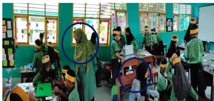
Gambar 3. Observer Mengamati Kegiatan Siswa Pada Saat Membuat Proyek

Tahap do yang pertama/open class dilaksanakan pada Selasa, 14 Januari 2025 pada pukul 09:30-11:00 WITA di ruang kelas V SDN 1 Lepak. Pada tahap ini merupakan implementasi dari Modul ajar yang dibuat. Guru model memulai pembelajaran dengan mengucapkan salam, memeriksa kehadiran siswa, dan mengajak siswa untuk berdoa bersama. Selanjutnya melakukan kegiatan apersepsi, menyampaikan tujuan pembelajaran dan menyampaikan materi yang akan di pelajari hari ini. Masuk kedalam kegiatan inti yakni kedalam langkah-langkah pembelajarn dari Project Based Learning yang dimulai dengan menanyakan pertanyaan mendasar dimana guru memberikan pertanyaan pemantik yang membuat siswa mencari solusi untuk memecahkan suatu masalah dengan menghasilkan sebuah produk, selanjutnya siswa dibagi menjadi 4 kelompok kecil, kemudian masing-masing observer mengamati satu kelompok tersebut. Siswa bersama guru model membuat desain proyek, menyusun jadwal pembuatan proyek, serta mulai mengerjakan proyek tersebut. Siswa terlihat antusias mengerjakan proyek diorama rantai makanan. Setelah selesai masing-masing mengevaluasi proyeknya dan mempresentasikan hasil pekerjaan masing-masing didepan kelas. Pada kegiatan penutup guru memberikan soal evaluasi untuk mengukur tingkat pemahaman dari siswa terkait dengan materi yang dipelajari.