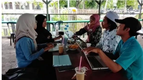
Gambar 2. Tahap Perencanaan ( Plan )

belajarnya. Hasil plan 1 menyepakati bahwa Lailatul Ismi di tunjuk menjadi guru model dalam proses pembelajaran sementara anggota kelompok lainnya seperti Herlina Istiani, Azhar, Zurriatun Hasanah dan M. Sarbini Zahid Sarif sebagai observer dalam proses pembelajaran.