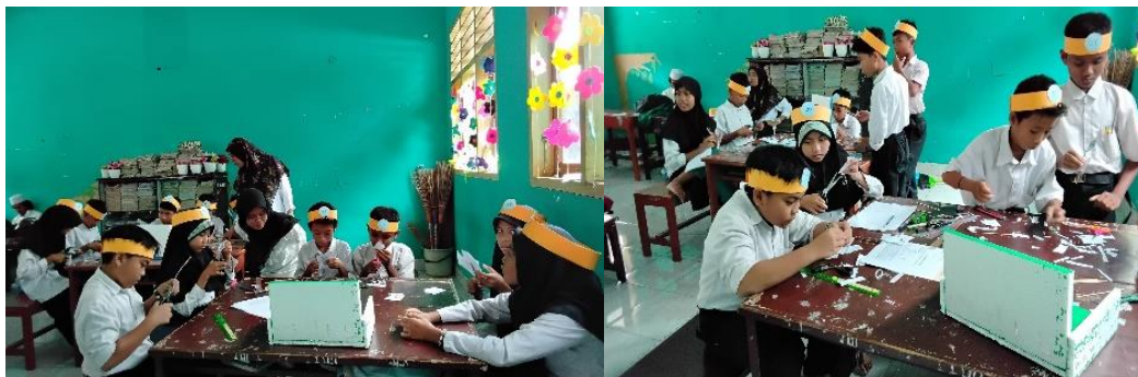
Gambar 5. Pelaksanaan Do Siklus II

Tahap do yang kedua/open class dilaksanakan pada Selasa, 22 Januari 2025 pada pukul 09:30-11:00 di ruang kelas V SDN 1 Lepak. Pada tahap ini merupakan implementasi dari Modul ajar yang dibuat pada plan ke 2 yang merupakan lanjutan dari modul ajar sebelumnya. Guru model memulai pembelajaran dengan mengucapkan salam, memeriksa kehadiran siswa, dan mengajak siswa untuk berdoa bersama. Selanjutnya untuk menambah motivasi siswa guru melakukan ice breaking terlebih dahulu sebelum melakukan kegiatan apersepsi, dilanjutkan dengan menyampaikan tujuan pembelajaran dan menyampaikan materi yang akan di pelajari hari ini.